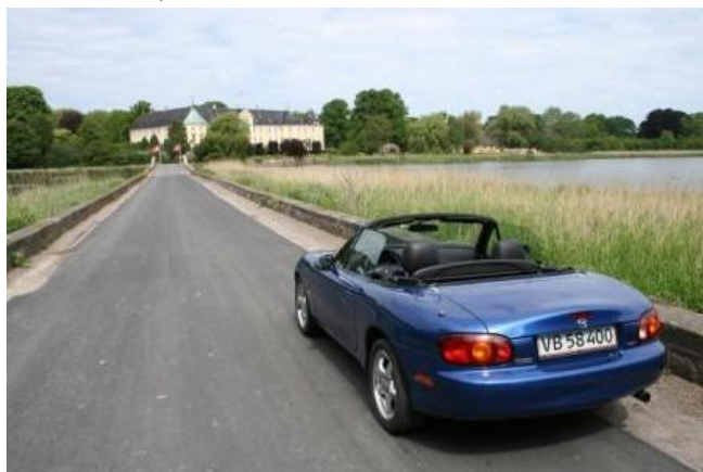
Gavnø Slot ligger ret idylisk

En tidlig søndag morgen midt i juni. En motorvejs-rasteplads ved Karlslunde. En lidt foruroligende vejrudsigt. Og en flok roadsterentusiaster i godt humør. Scenen var lagt for endnu en omgang Classic Autojumble på Gavnø Slot udenfor Næstved.