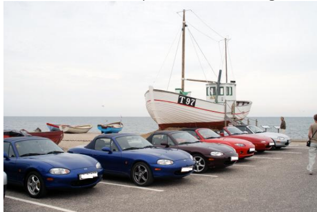
Bilerne linet op foran en standkutter i Klitmøller

Hanstholmfæstningen blev indtaget og nogle af os måtte absolut i "turistfælden", det lille ammunitionstog fra 2. verdenskrig. Herfra tog vi turen sydpå mod Nors og Øster og Vester Vandet tilbage til Klitmøller hvor vi spiste frokost i røgeriet.