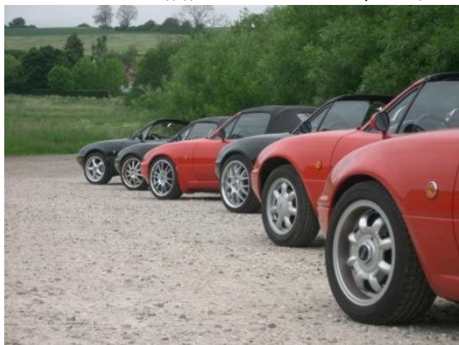
Formanden(s kone) og kassereren er enige om, at de pæneste fælg er dem på bil nr. 2 ☺☺