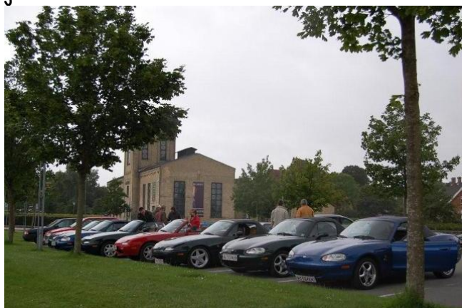
Dagens Maglesø møde endte på havnen i Roskilde

Efter et par timer begav 8 af os, os ud på en meget flot 1½ times rute i nabolaget, som Søren på forhånd havde forberedt. Den ledte os ud på nogle af de veje i nabolaget vi ikke tidligere har frekventeret og selvfølgelig også nogle af de mere kendte. Undertegnede mener selvfølgelig, de andre er nogle skvat, når de stopper, for at slå kalechen op, bare fordi der kommer et lille skybrud. Så længe man kører, bliver man jo ikke våd ☺☺