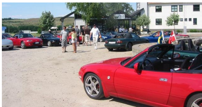
Fører bilen havde selvfølgelig både det svenske og danske flag oppe

Vi glæder os til svenskerne atter kommer på besøg hos os i starten af september.