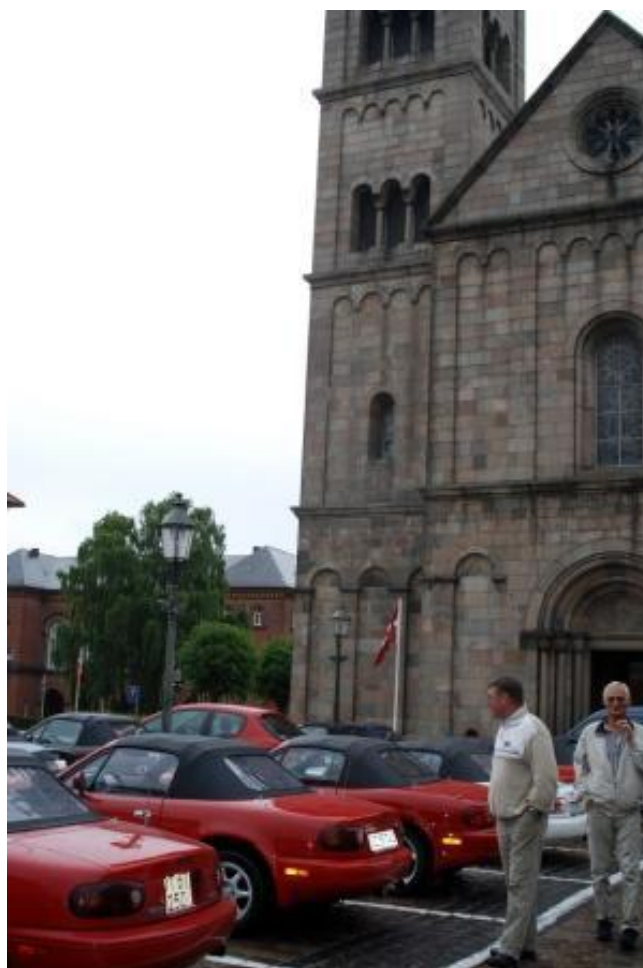
MX-5'erne linnet op foran Viborg Domkirke

Turen fortsatte gennem Kratskoven til Dollerup hvor vi nød det smukke landskab.