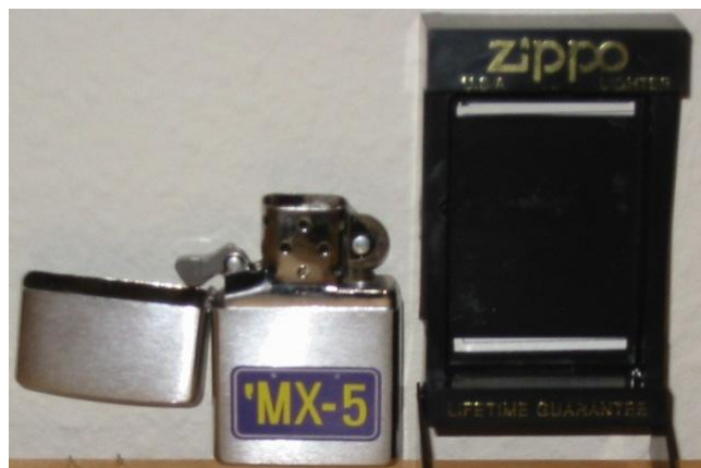
Zippo lighter m. logo incl. evt. forsendelse Normalpris 225,- Medlemspris 175,-

Jeg har alle effekter med mig til de arrangementer jeg deltager i og ellers kan det bestilles på wsj@mx5club.dk