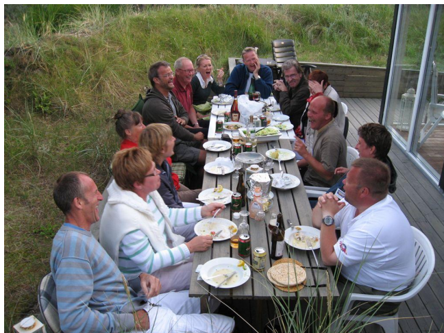
Der hygges omkring bordet i sommerhuset

Pigerne var ekstremt hurtige til at få maden på bordet, mens der lige blev drukket et par øl og sparket dæk udenfor. Menuen: ovnstegte langer på en bund af urter med nye kartofler og salat. En Herreret!