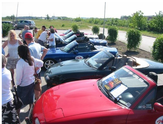
Nogle få af de i alt 40 biler der deltog

For de "uindviede" vil jeg benytte anledningen til et lille svensk-kursus ☺.