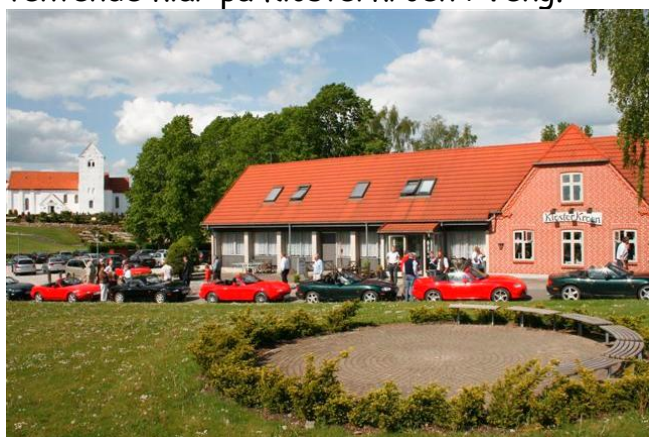
Der kigges biler ved Kloster Kroen i Veng