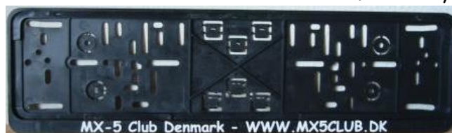
Nummerpladerammer med teksten "MX-5 Club Denmark - WWW.MX5CLUB.DK" excl. evt. forsendelse.