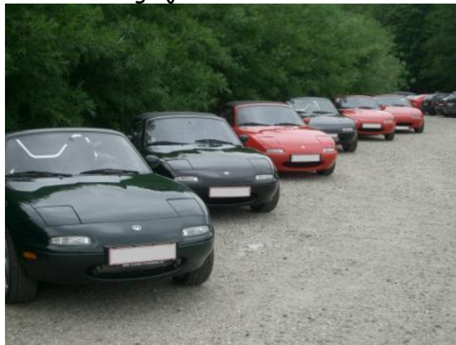
"Klaplygterne" linet op ved Tadre Mølle

Det var "klaplygte" dag på Maglesø den første lørdag i juni.