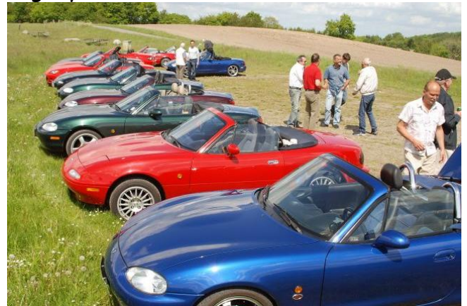
Pitstop på Slaggaards Banke

røde, grønne, grå, blå og sorte små kuglelyns zoom-zoom'e forbi.